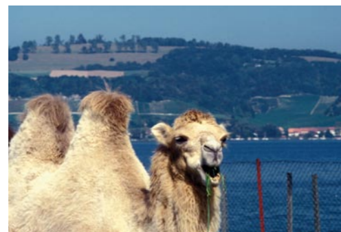
Einmal im Jahr kommt der Zirkus Knie nach Murten.

Weitgehend unverbaute Ufer und gut zugängliche, natürliche Sandstrände machen die ehemalige Expo-